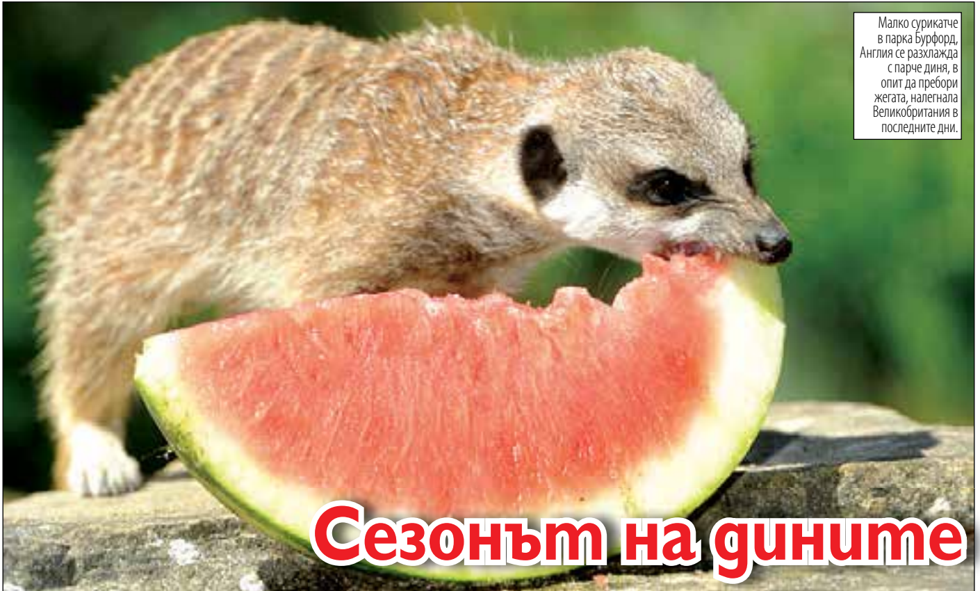
Малко сурикатче в парка Бурфорд, Англия се разхлажда с парче диня, в опит да пребори жегата, налегнала Великобритания в последните дни.