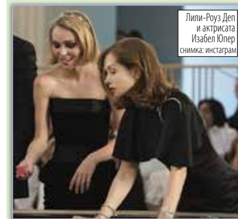
Лили-Роуз Дел и актрисата Изабел Юлер

Дефилето на Шанел в рамките на Седмичата на висшата мода в Париж предизвика сензация. Дизайнерът Карл Лагерфелд е ползвал триизмерни технологии за създаване на нова версия на легендарния костюм тайор на модната къща. Колекцията бе показана сред декор, пресъздаващ зала в казино, в Гран пале в Париж. Сред присъствалите на дефилето знаменитости бяха Кристен Стюарт, Джулиан Мур, Ванеса Паради, дъщеря ѝ Лили-Роуз Дел, Джералдин Чаплин, Гейбриъл-Кейн Дей-Луис, синът на Изабел Аджани и Даниел Дей-Луис. Вечерни рокли са украса от пера, бродерии, цветя и перли. В края на дефилето булчинският тоалет, бе носен от Кендъл Дженър, сестрата на Ким Кардашян.