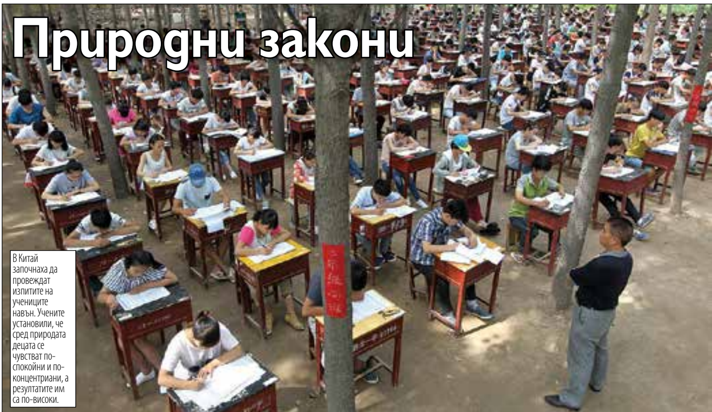
В Китай започнаха да провеждат изпитите на учениците навън. Учените установили, че сред природата децата се чувстват по-спокойни и по-концентрирани, а резултатите им са по-високи.