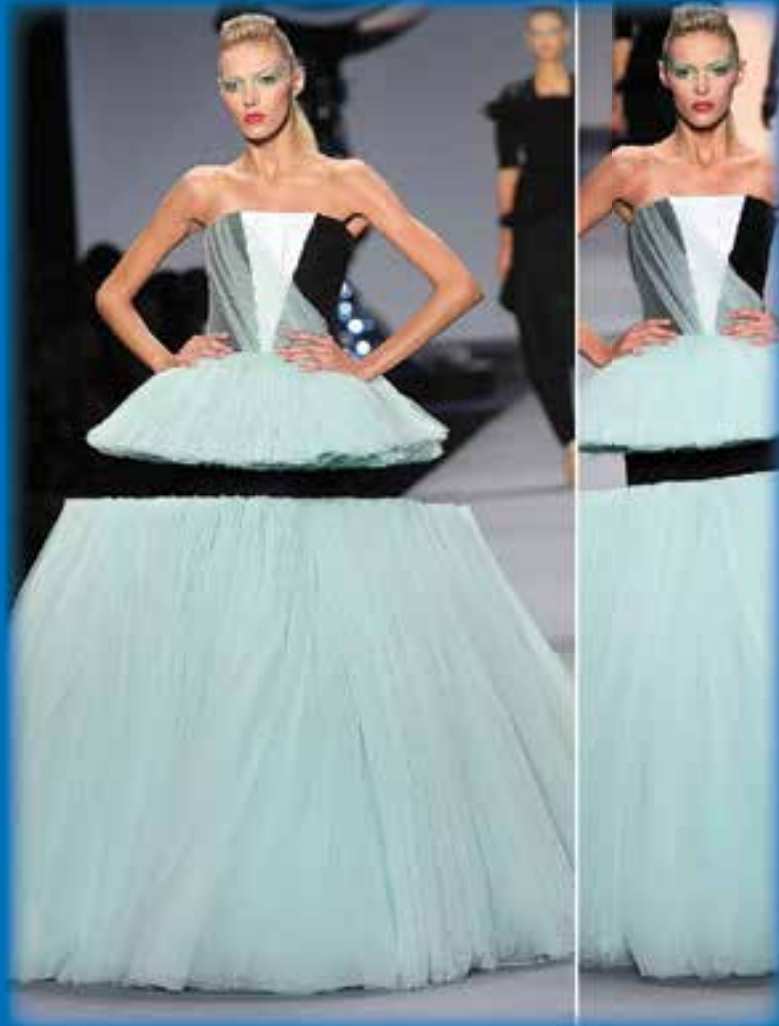
Нестандартен тоалет, показан в Милано, предизвика вниманието на модните специалисти. Вечерната рокля доказа за пореден път несъвършенството на човешкото око и обра оваците на публиката.