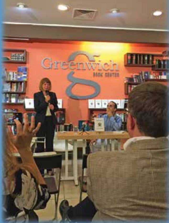
снимка: 19 минути