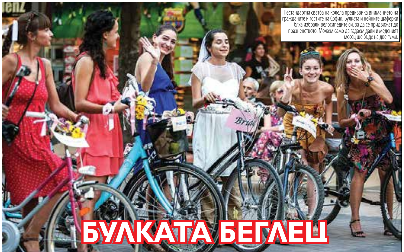
Нестандартна сватба на колела предизвика вниманието на гражданите и гостите на София. Булката и нейните шаферки бяха избрали велосипедите си, за да се придвижат до празненството. Можем само да гадаем дали и меденият месец ще бъде на две гуми.