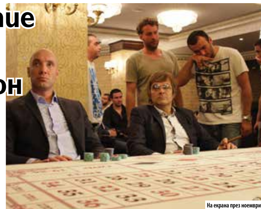
На екрана през ноември

интересът към Пог прикритие е провокативен и от очакването как ще продължи историята. Не само за зрителите в България, но и за стотици милиони по света, защото сериалът вече е продаден в 149 държави в Европа, Централна, Северна и Латинска Америка и Азия. От средата на септември българската поредица завладя публиката и в Италия. Трима са вече известните нови актьори, които близат