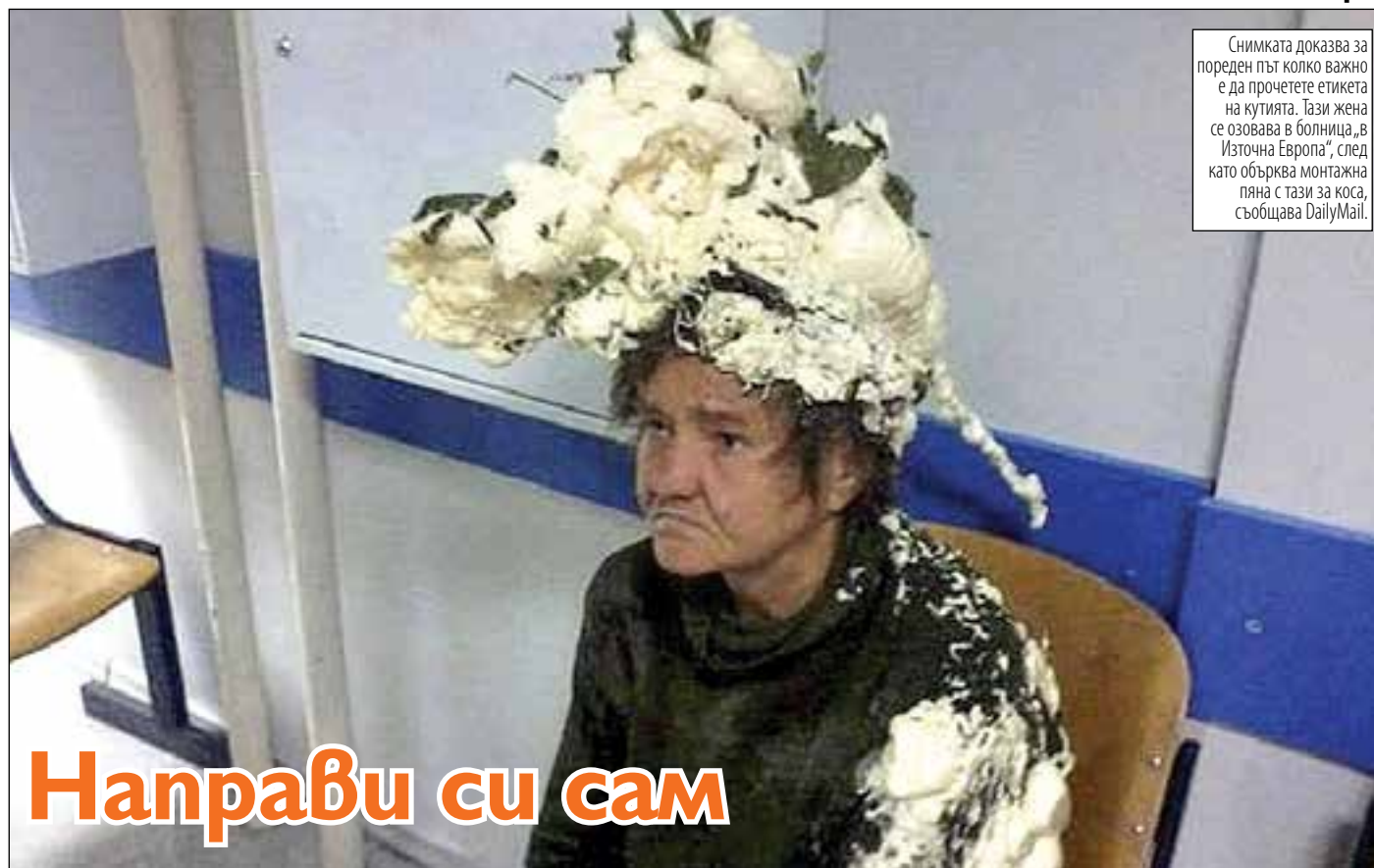
Снимката доказва за пореден път колко важно е да прочетете етикета на кутията. Тази жена се озовава в болница „в Източна Европа“, след като обърква монтажна пяна с тази за коса, съобщава DailyMail.