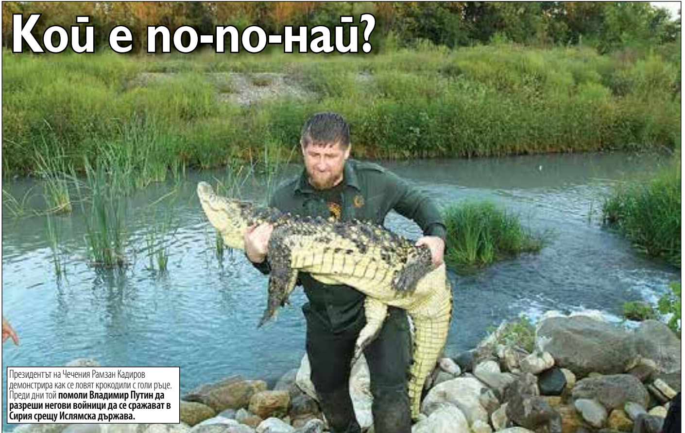
Президентът на Чечения Рамзан Кадилов демонстрира как се ловят крокодили с голи ръце. Преди дни той помоли Владимир Путин да разреши негови войници да се сражават в Сирия срещу Ислямска държава.