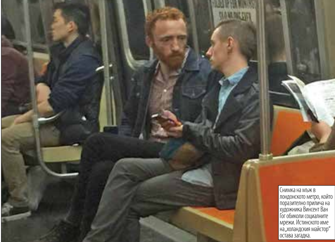
Снимка на мъж в лондонското метро, който поразително прилича на художника Винсент Ван Гог обиколи социалните мрежи. Истинското име на „холандския майстор“ остава загадка.

превзел Константинопол? Абсолютна тишина. - Тогава ще извиквам по дневника. Да каже номер 6, Петърчо. Петърчо: - Не съм аз, госпожице. Сигурно Гошко го е взел. Учителката отива при заместник-директора и му обяснява, че 6 Б клас се подиграва с нея и не иска да отговаря, който е превзел Константинопол. Заместник-директорът: - Мдаааа...6Б, значи... Константинопол, значи... А той скъпо ли струва, той Константинопол? Учителката, обяна в сълзи, отива при директора. Директорът я изслушва и казва: - 6 Б, казвате? Не, тия са такива гадове, че никога няма да го върнат.