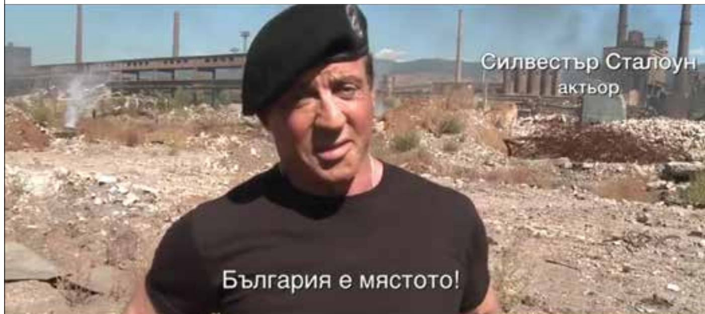
Силвестър Сталоун актьор

След като световните медии гръмнаха, че стреляме на месо, точно навреме идва завъртнето на „рекламен за страната” клип по същите тези световни медии със застрашителния Силвестър Сталоун, известен като Рамбо, който с кривата си усмивка и напред лунен пейзаж тип Чернобил съобщава, че „България е мястото”. Елате да ви гръмнем, с други думи!