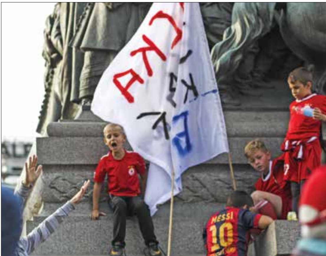
Вчера феновете на ЦСКА проведоха поредното мероприятие в името на спасяването на червения клуб. На Армията дойдоха около 3500 души. След демонстративна двустранна игра, която бе организирана на мястото на мача с Витоша-Бистрица, заради отказа на тигрите да изиграят срещата от В-група, запаляковците потеглиха към езерото Ариана, а впоследствие се отправиха и към парламента за планиран мирен протест.