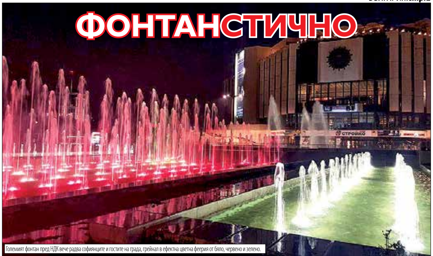
Големият фонтан пред НДК вече радва софиянците и гостите на града, грейнал в ефектна цветна феерия от бяло, червено и зелено.