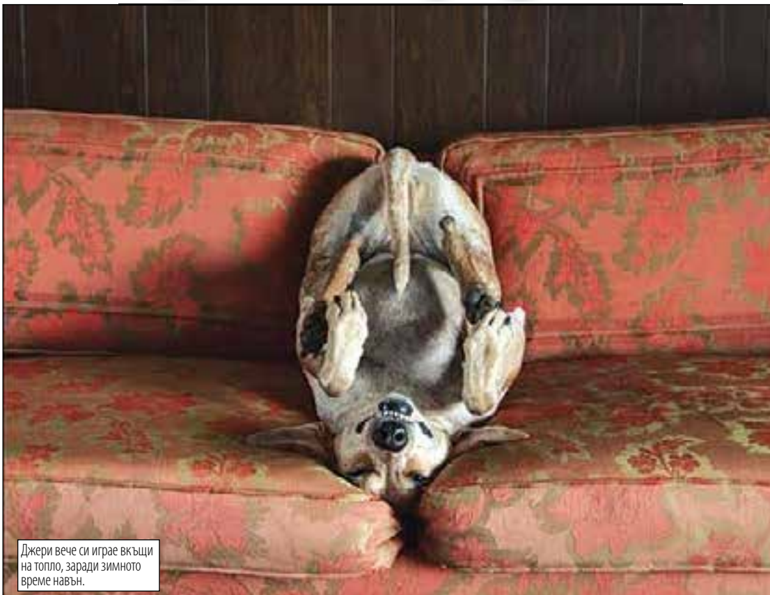
Джери вече си играе вкъщи на топло, заради зимното време навън.