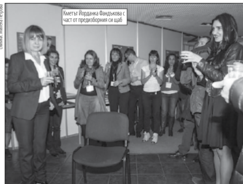
Кметът Йорданка Фандъкова с част от предизборния си щаб