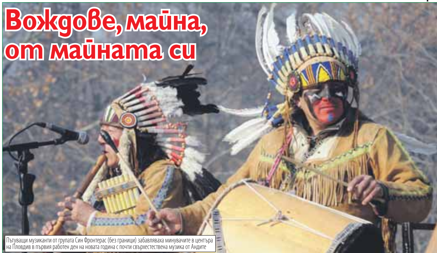
Пътуващи музиканти от групата Син Фронтерас (без граници) забавляваха минавачите в центъра на Пловдив в първия работен ден на новата година с почти свърхестествена музика от Андите