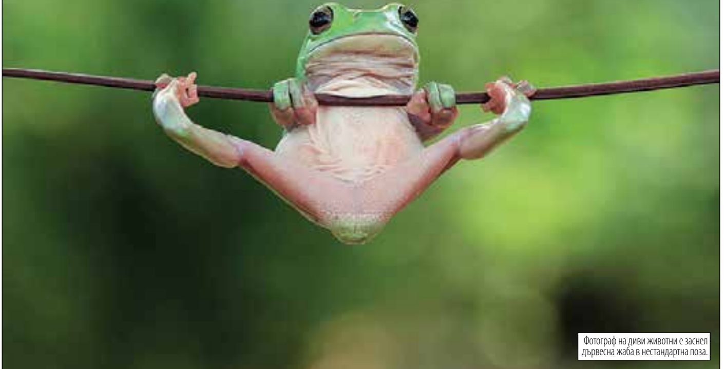
Фотограф на диви животни е заснел дървесна жаба в нестандартна поза.