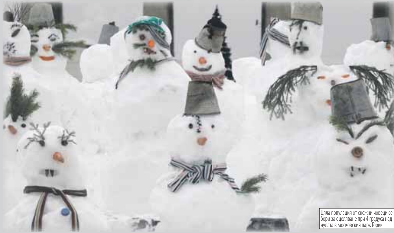
Цяла популация от снежни човеци се бори за оцеляване при 4 градуса над нулата в московския парк Горки