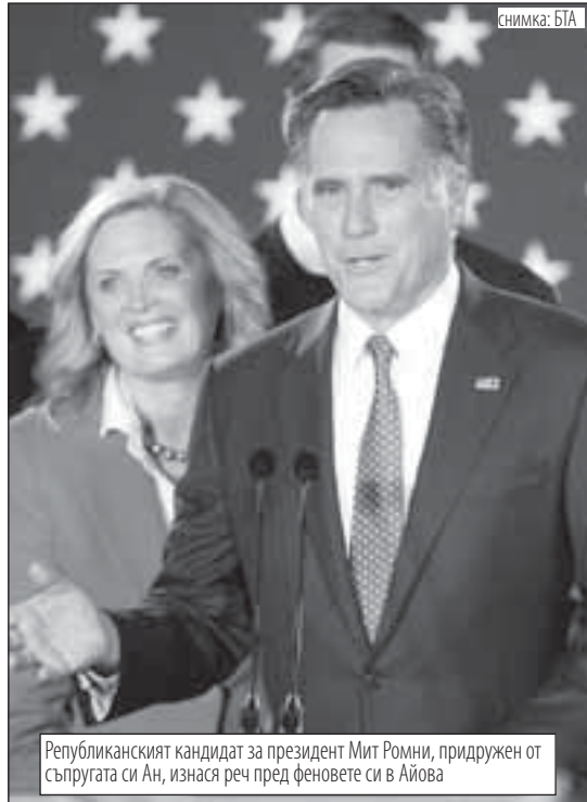
Републиканският кандидат за президент Мит Ромни, придружен от съпругата си Ан, изнася реч пред феновете си в Айова

Именно Ромни се оказа най-богатият кандидат-президент през последните 10