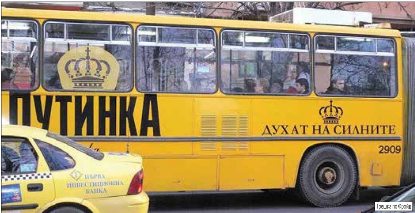
Грешка по Фройд