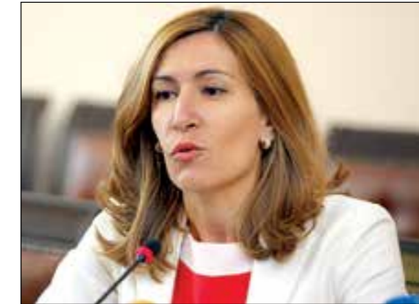
Съюзникът ни Украйна ни прецака - забрани трансферните полети над Русия и така чартърите се оскъпиха

ятел." Украйна миналата транзитни полети на седмица забрани всички руски компании в нейно-