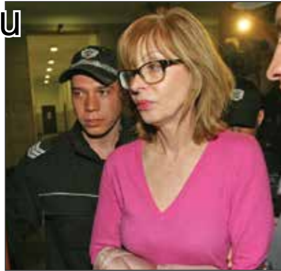
Гнилата ябълка на съдебната система носи палто за 50 бона, рушвет от могов бос

Ченалова, прочула се и с оправдателната присъда на двойния убиец от дискотека Соло, неотдавна бе уволне-