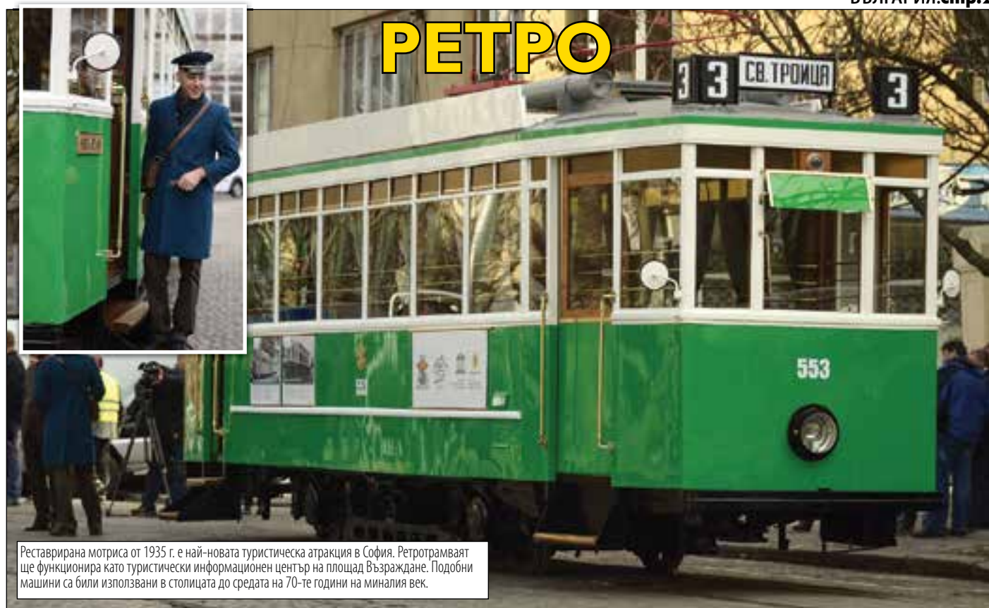
Реставрирана моториса от 1935 г. е най-новата туристическа атракция в София. Ретротрамваят ще функционира като туристически информационен център на площад Възраждане. Подобни машини са били използвани в столицата до средата на 70-те години на миналия век.