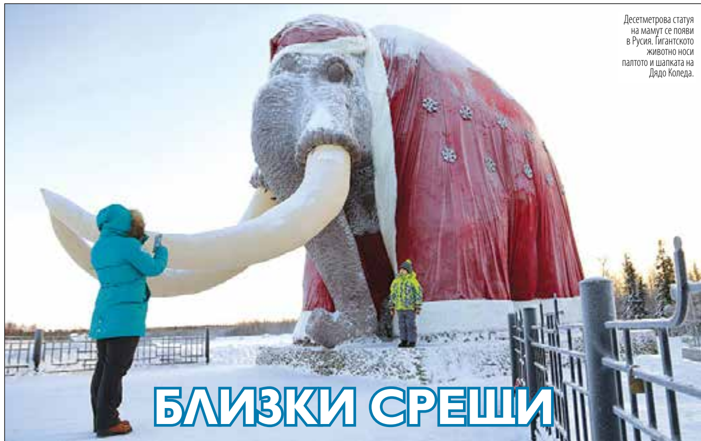
Десетметрова статуя на мамут се появи в Русия. Гигантското животно носи палтото и шапката на Дядо Коледа.