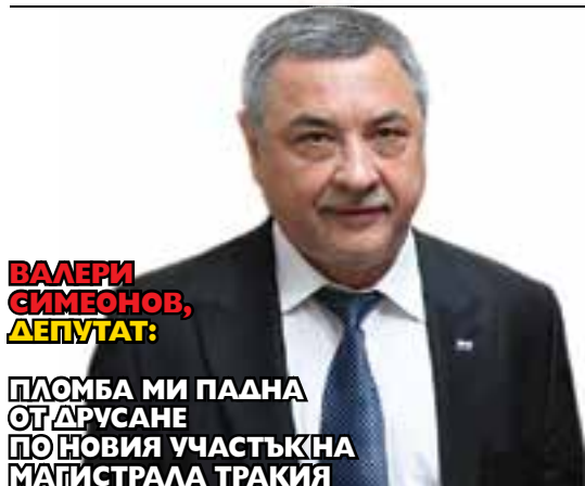
ВАЛЕРИ СИМЕОНОВ, ДЕПУТАТ:

ПЛОМБА МИ ПАДНА ОТ ДРУСАНЕ ПО НОВИЯ УЧАСТЪК НА МАГИСТРАЛА ТРАКИЯ