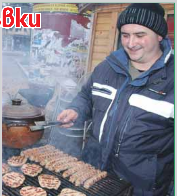
Испанският тореадор Давид Мора е пронизан свирепо от разярен бик на традиционната корида в Манисалес (Кол), докато в същото време скарите с говеждо и свинско на коледно-новогодишния базар в Благоевград цвърчат с пълна сила