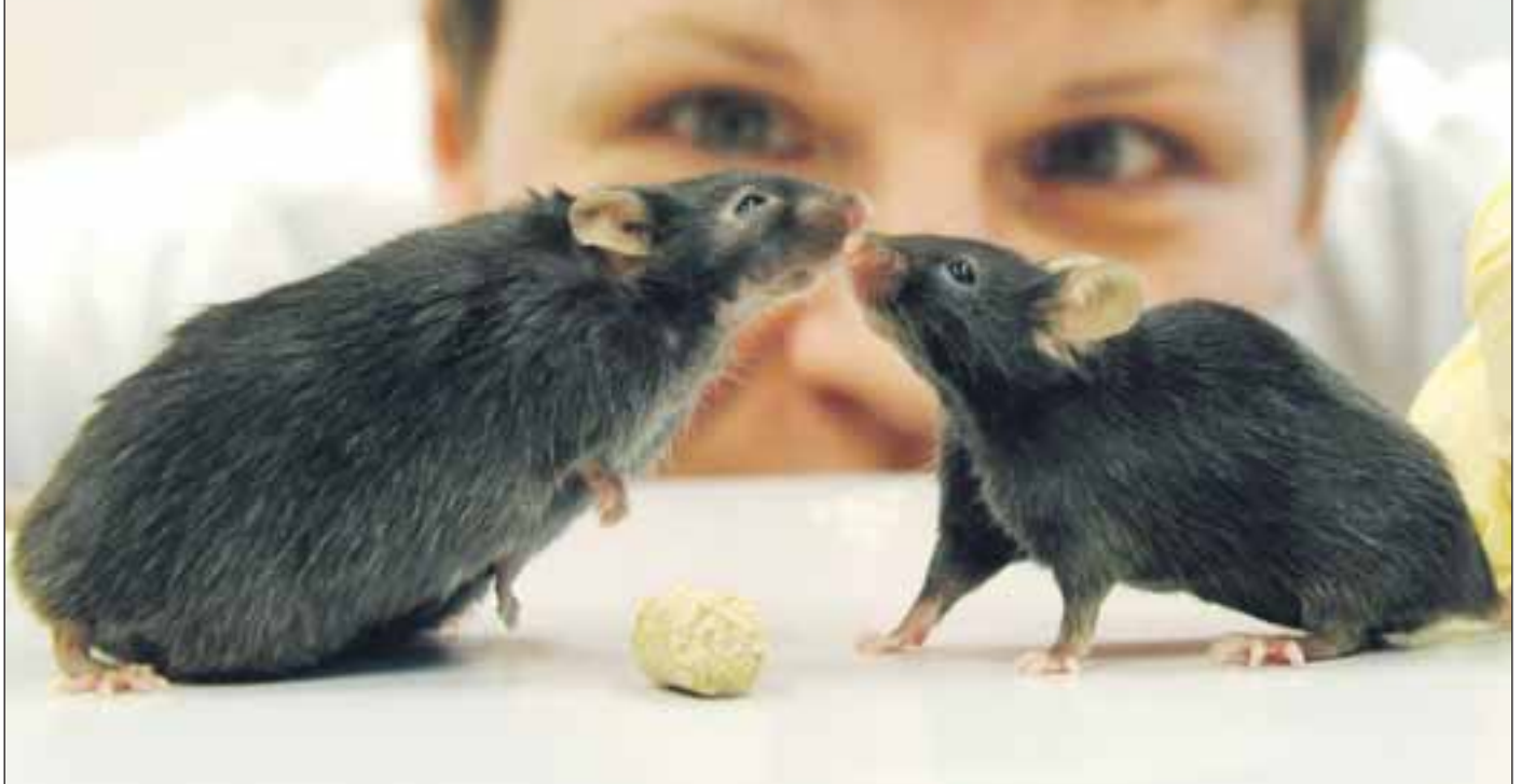
Това не е модерна илюстрация на великата книга на Джон Стайнбек За мишките и хората, това етиюд между дебела мишка (52 грама) и мишка с нормално тегло (около 20 грама) в тъканната лаборатория на университета в Лайпциг (Гер). Там учените се опитват да открият крайната диета за хапче за отслабване без странични ефекти. По тази причина те анализират проби от тъкани на затлъстели хора и животни