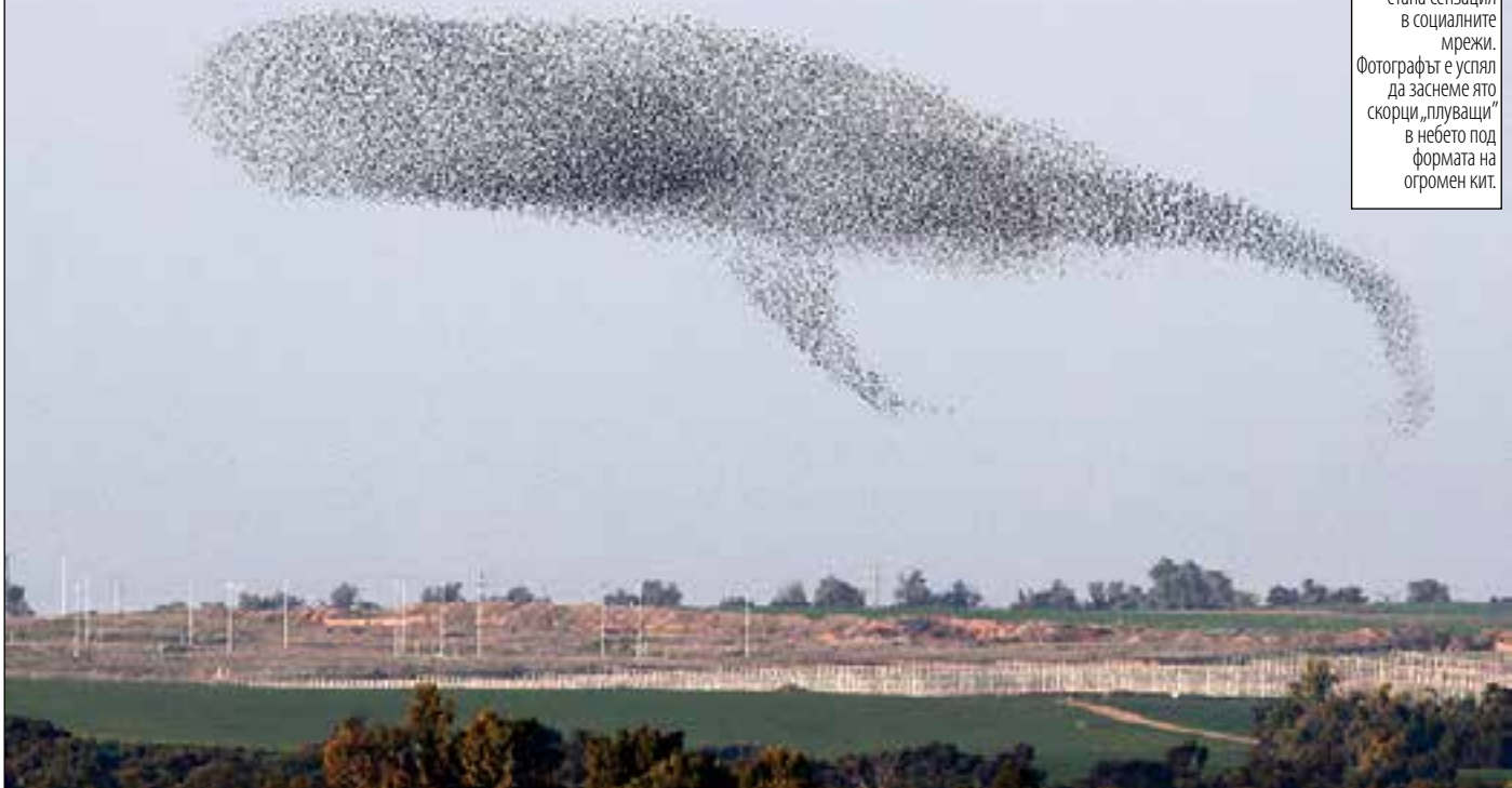
Снимка на мигриращи птици направена от Амир Коен стана сензация в социалните мрежи. Фотографът е успял да заснеме ято скорци „плуващи“ в небето под формата на огромен кит.