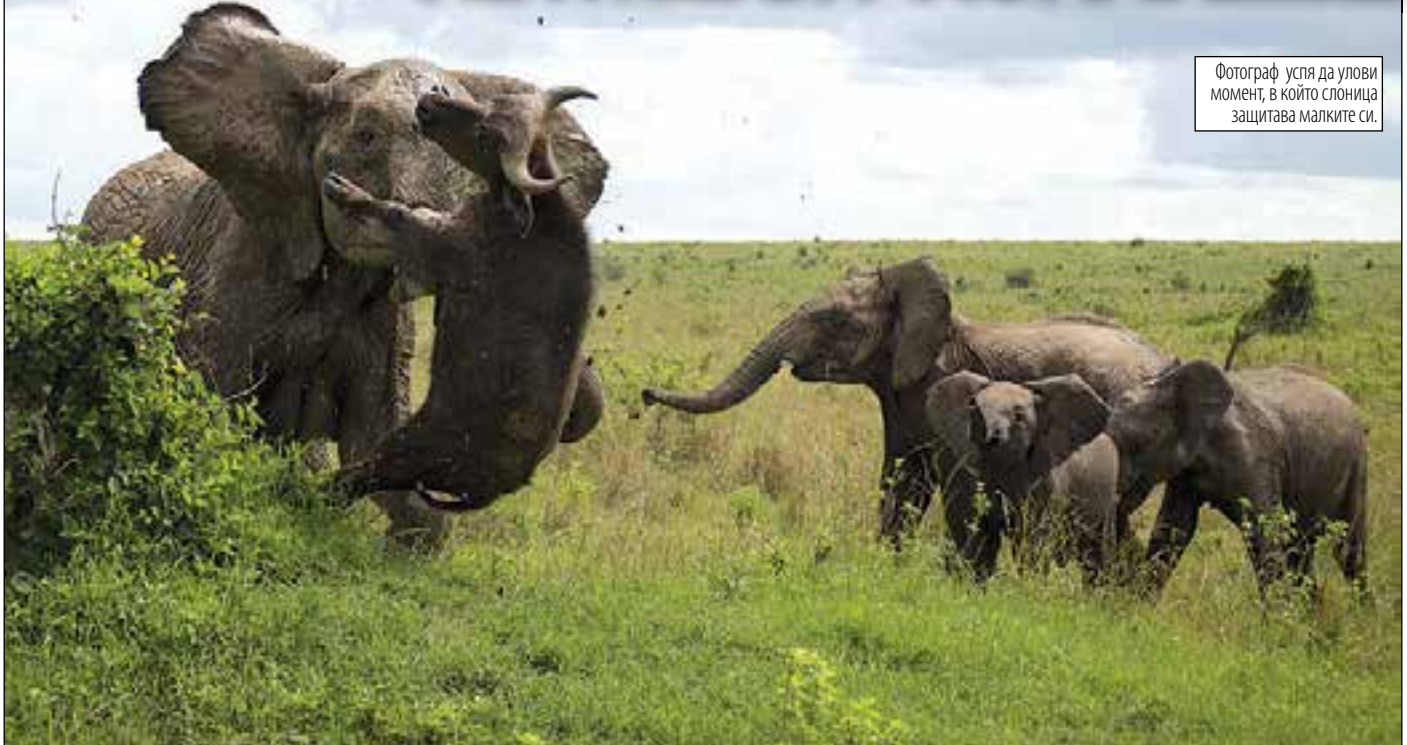
Фотограф успя да улови момент, в който слоница защитава малките си.