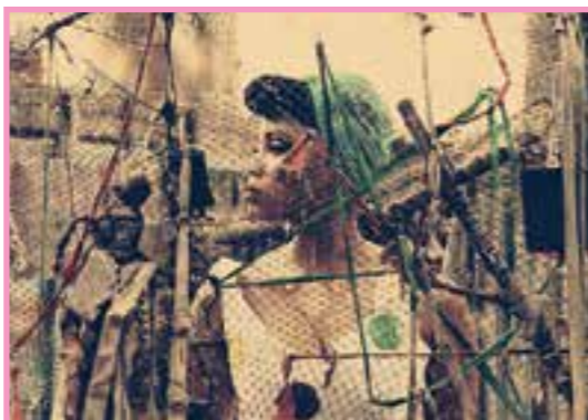
Itanu с концерт у нас

вен за изкуството на кулинарията от своите ученици-готвачи, носителка на титлата Мис Бикини, успешен модел в Италия, както и 25-годишна ромка, която идва с цял оркестър за подкрепа са сред любо-