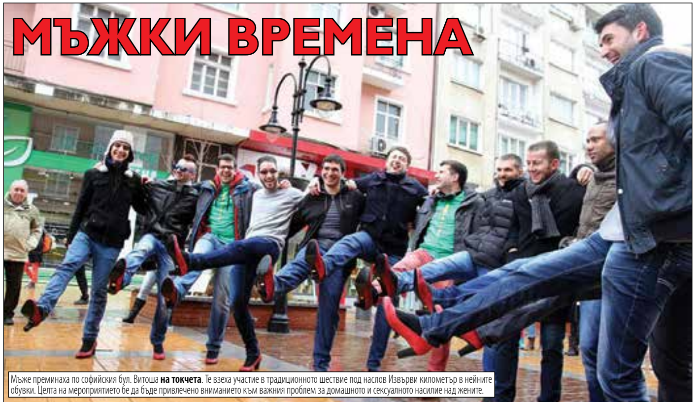
Мъже преминаха по софийския бул. Витоша на токчета . Те взеха участие в традиционното шествие под наслов Извърви километър в нейните обувки. Целта на мероприятиято бе да бъде привлечено вниманието към важния проблем за домашното и сексуалното насилие над жените.