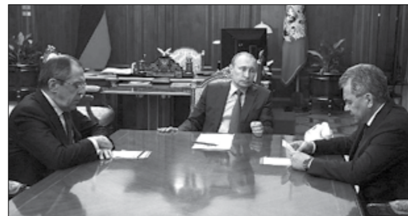
Първите руски самолети вече са си във Воронеж, оценките за решението на Кремъл са ОК

Владимир Путин отново изненада сериозно американския президент Барак Обама и останалите си колеги като в централната информационна емисия на Първи канал на руската телевизия обяви в присъствието на своя военен и на външния си министър изтеглянето на неговите въздушни сили от Сирия. Повече от час липсваше официална реакция от Вашингтон, Брюксел и която и да било друго възлова столица по темата. Само сирийският президент Башар Асад, поканил руснаците да помогнат на правителствената му армия в борбата