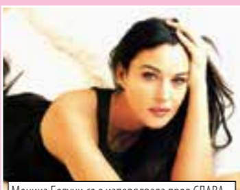
Моника Белучи се е изповядвала пред СЛАВА

МОНИКА БЕЛУЧИ, ДЖУД ЛОУ, АНДЖЕЛИНА ДЖОЛИ, АЛ ПАЧИНО, ЛЕО ДИ КАПРИО, ДВА ПЪТИ ДЖОРДЖО АРМАНИ, 4 ПЪТИ РОБЕРТО КАВАЛИ, ДОНАТЕЛА ВЕРСАЧЕ, А СЪЩО ЕРОС РАМАЦОТИ, АЛ БАНО, ГУИНЕТ ПОЛТРОУ, ЕМИР КУСТУРИЦА, ДИЕГО МАРАДОНА, КОЛИН ФЪРТ, РУПЪРТ ЕВЕРЕТ, ПАРИС ХИЛТЪН, СЕЛМА ХАЙЕК, КАРЛ ЛАГЕРФЕЛД, КРИСТИАН ЛАКРОА, ЛАУРА БИАДЖОТИ, СКОТ АДКИНС, ДЖЕЙСЪН МОМОА, ЦЕЦА ВЕЛИЧКОВИЧ – САМО СЛАВА МОЖЕ ДА СЕ ПОХВАЛИ В БЪЛГАРИЯ С ИНТЕРВЮТА С ВСИЧКИ ТЕЗИ, А И С МНОГО ДРУГИ СВЕТОВНИ ЗВЕЗДИ СРЕД БЪЛГАРСКИТЕ МЕДИИ. А МЕЖДУ РОДНИТЕ ЗНАМЕНОСТИ ПРОСТО НЯМА ТАКИВА, КОИТО ДА НЕ СА СПОДЕЛИЛИ НАЙ-ИНТИМНИТЕ СИ ТАЙНИ И ПРЕЖИВЯВЯНИЯ СЪС СПИСАНИЕТО – ОТ ГАЛЕНА И ПРЕСЛАВА ДО ОПЕРНИТЕ ПРИМИ. ТОВА СВЪРШИХМЕ ПРЕЗ ПЪРВИТЕ СИ ДЕСЕТ ГОДИНИ. В СЛЕДВАЩИТЕ 10 НИ ЧАКАТ ОЩЕ МНОГО ПОДВИЗИ.