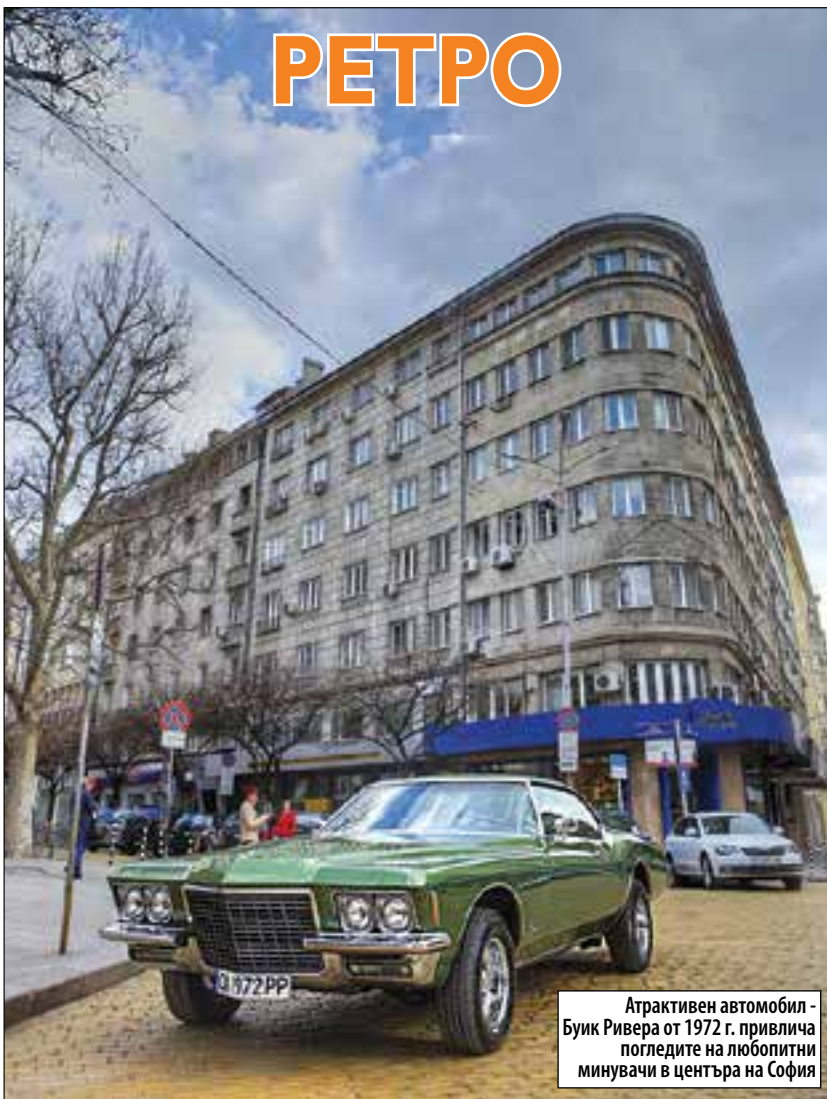
Атрактивен автомобил - Бюик Ривера от 1972 г. привлича погледите на любопитни минувачи в центъра на София