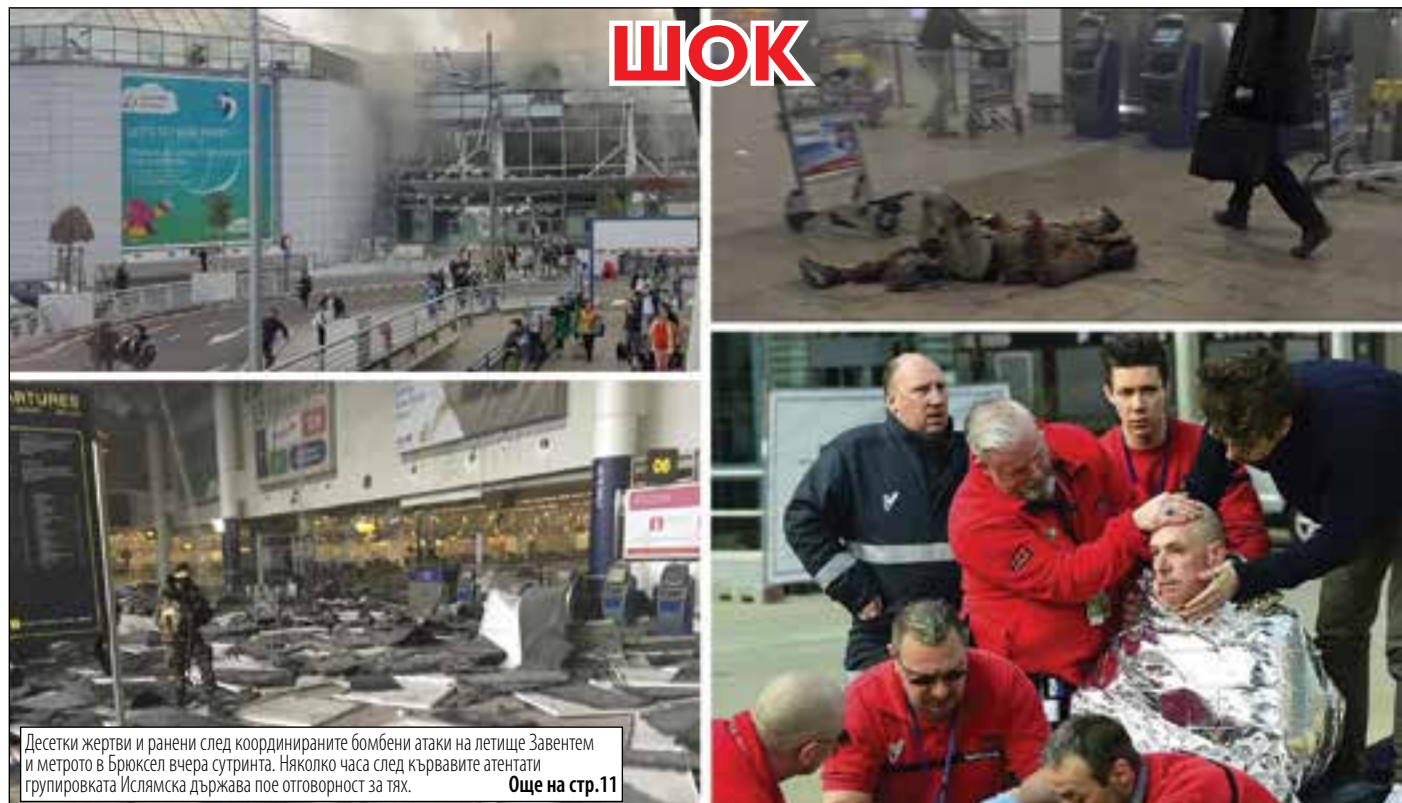
Десетки жертви и ранени след координираните бомбени атаки на летище Завентем и метрото в Брюксел вчера сутринта. Няколко часа след кървавите атентати групировката Ислямска държава пое отговорност за тях. Още на стр.11

>>64% ОТ ХОРАТА ПЪТУВАТ С КАРТИ С ОТСТЪПКА, ЕДВА 15% ДУПЧАТ ЕДНОКРАТНИ