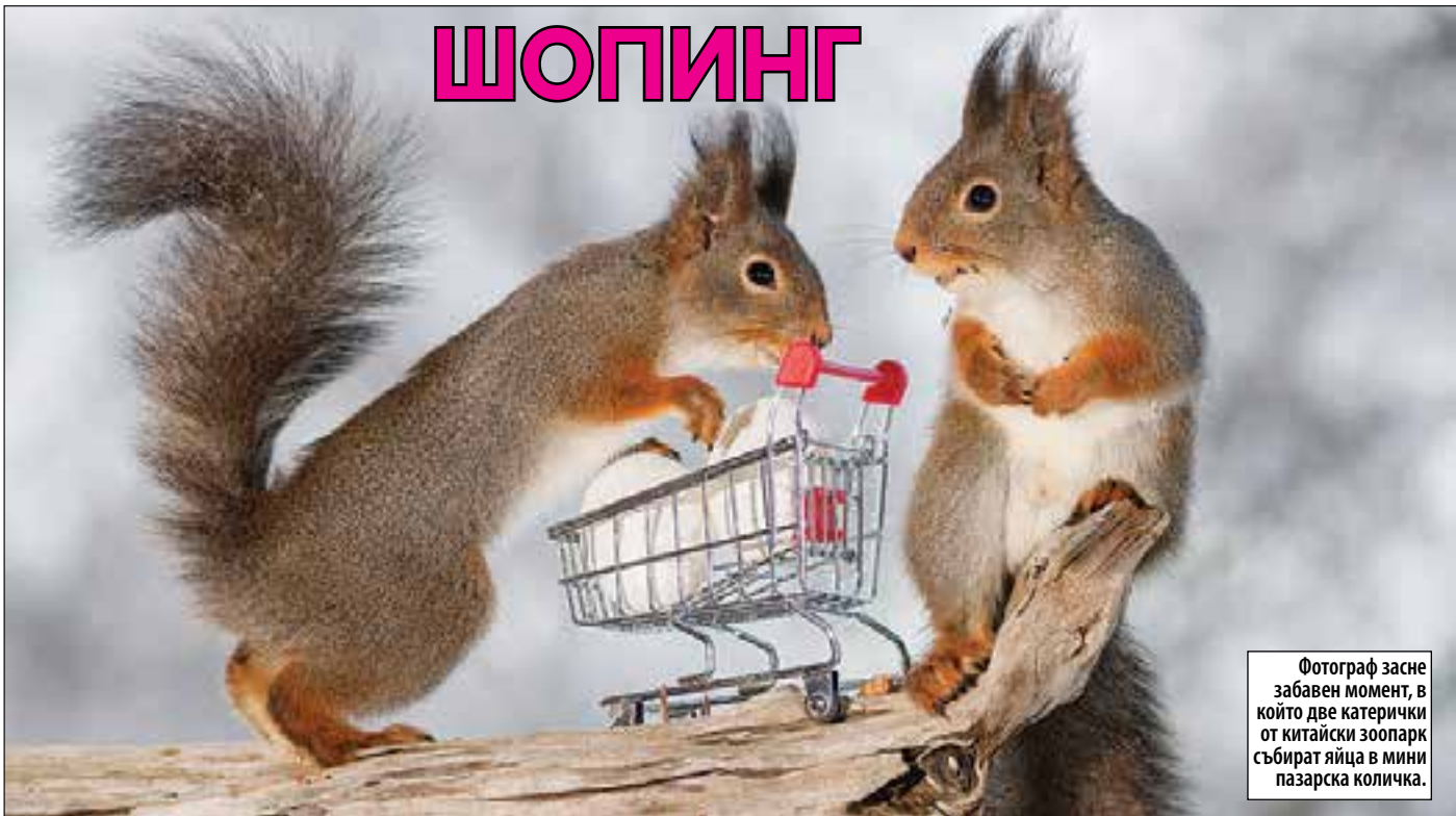
Фотограф засне забавен момент, в който две катерички от китайски зоопарк събират яйца в мини пазарска количка.