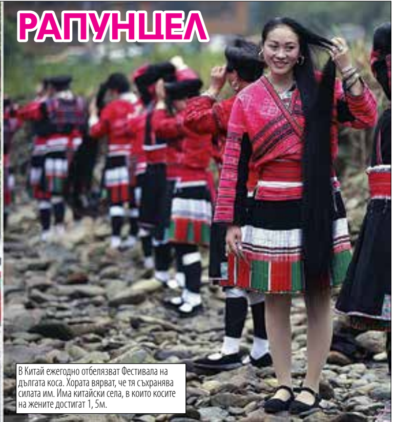
В Китай ежегодно отбелязват Фестивала на дългата коса. Хората вярват, че тя съхранява силата им. Има китайски села, в които косите на жените достигат 1,5м.