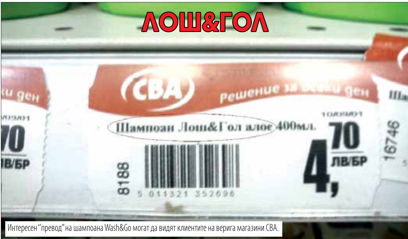
Интересен "превод" на шампоана Wash&Go могат да видят клиентите на верига магазини СВА.