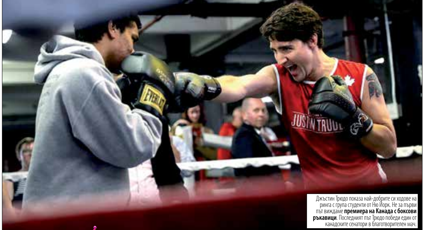
Джъстин Трюдо показа най-добрите си ходове на ринга с група студенти от Ню Йорк. Не за първи път виждаме премиера на Канада с боксови ръкавици. Последният път Трюдо победи един от канадските сенатори в благотворителен мач.