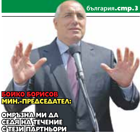
БОИКО БОРИСОВ МИН.-ПРЕДСЕДАТЕЛ:

ОМРЪЗНА МИ ДА СЕДЯ НА ТЕЧЕНИЕ С ТЕЗИ ПАРТНЬОРИ