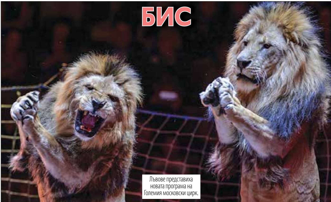
Лъвовете представиха новата програма на Големия московски цирк.