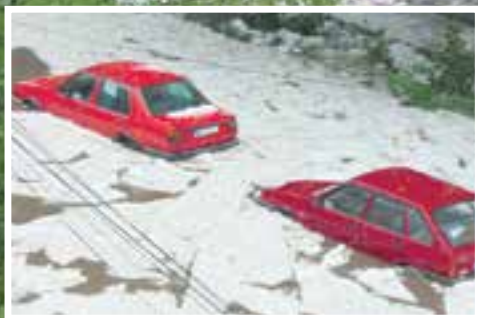
Градушка удари Ловеч в понеделник малко след 18 часа. Природното бедствие блокира града с часове. Част от улиците бяха непроходими и останаха затворени за движение. Часове след бурята тротоарите все още бяха побелели.