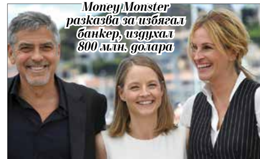
Money Monster разказва за избягал банкер, издухал 800 млн. долара