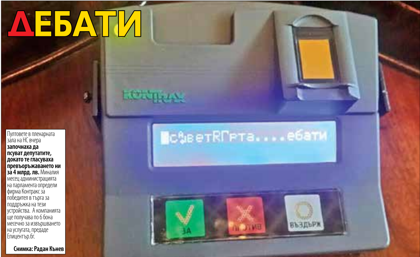
Пултовете в пленарната зала на НС вчера започнаха да псуват депутатите, докато те гласуваха превъоръжаването ни за 4 млрд. лв. Миналия месец администрацията на парламента определи фирма Контракс за победител в търга за поддръжка на тези устройства. А компанията ще получава по 6 бона месечно за извършването на услугата, предаде Епицентър.бг.