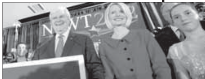
Бившият председател на Камарата на представителите Нют Гингрич с третата си съпругата Калиста Бисек

Тексас събира 13 на сто от гласовете. „След вота в Южна Каролина надпреварата би могла да тръгне в различна посока и да стане много оспорвана“, коментират американските медии. „Нуждая се от помощта ви“, заяви Гингрич пред тълпа от симпатизанти. „Имаме възможността да номинираме истински консерватор, който умее да води дебати и може да се изправи срещу Барак Обама“, изтъкна още той.