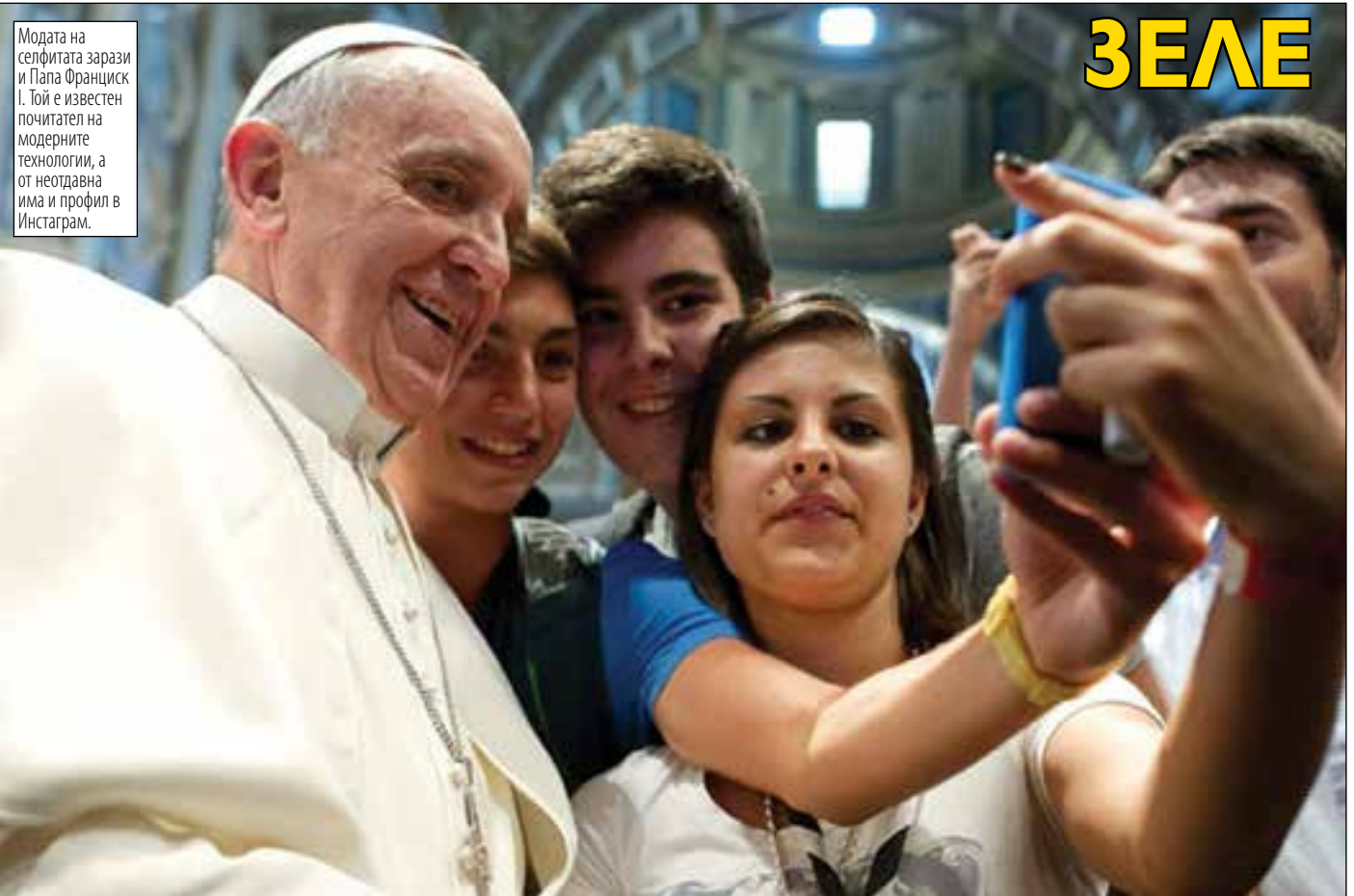
Модата на селфитата зарази и Папа Франциск I. Той е известен почитател на модерните технологии, а от неотдавна има и профил в Инстаграм.

>>ВМЕСТО 5 МИНУТИ, ЖИТЕЛИТЕ НА КВАРТАЛА ПЪТУВАТ НАД ПОЛОВИН ЧАС ДО ОКОЛОВРЪСТНОТО ШОСЕ