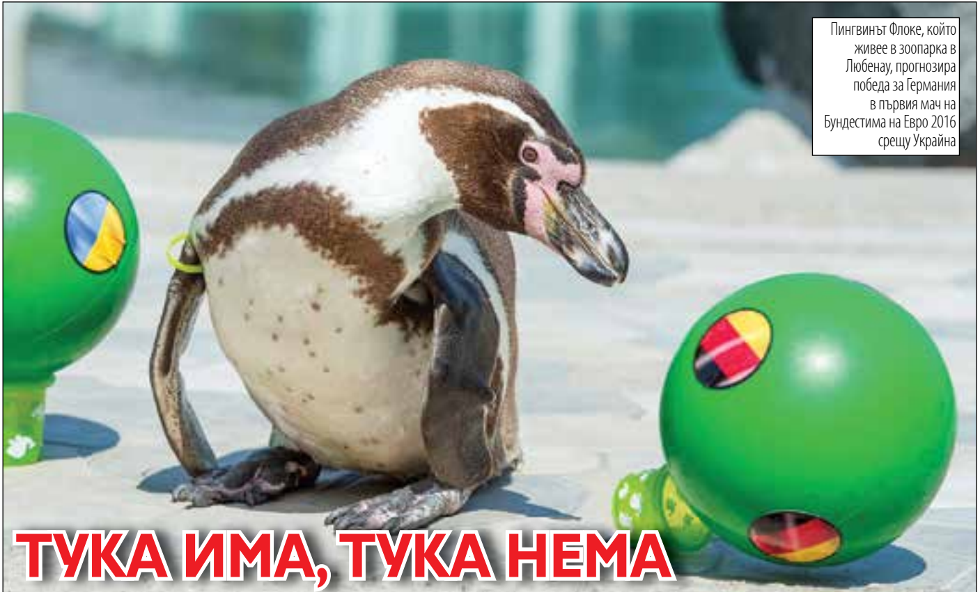
Пингвинът Флоке, който живее в зоопарка в Любенау, прогнозира победа за Германия в първия мач на Бундестима на Евро 2016 срещу Украйна