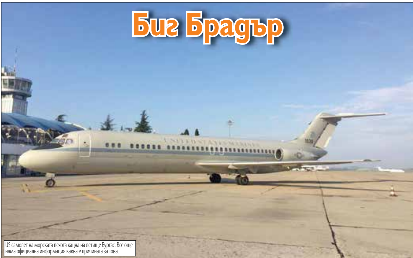
US самолет на морската пехота кацна на летище Бургас. Все още няма официална информация каква е причината за това.