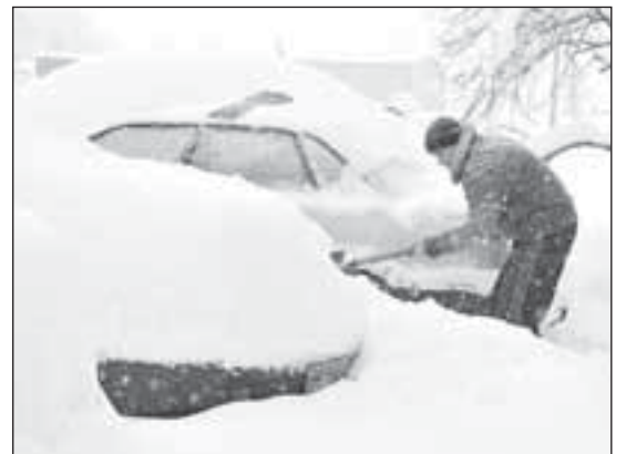
Обилният сняг, който не спря да вали от миналата вечер във Враца, натрупа над 60-сантиметрова покривка. В почистването на града и селата в общината участваха над 40 снегорина и от началото на валежите бяха хвърлени над 100 тона сол и пясък

Снежната покривка в София беше 57 см според метеоролози от няколко години в столицата не е имало толкова сняг.