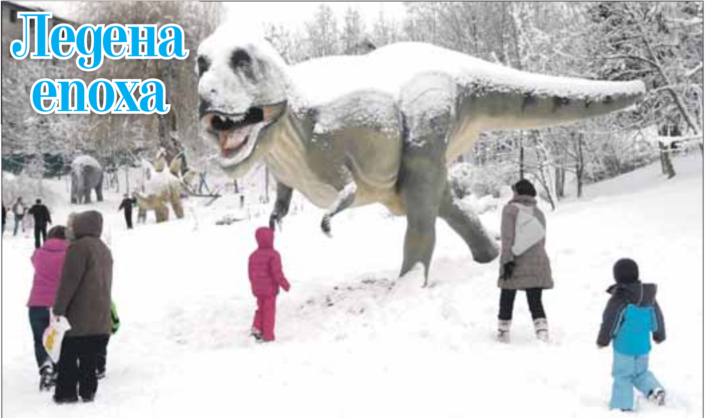
Динозавър се дзвери в снега на посетителите в парка Пионерска долина в Сараево (Босна и Херцеговина) при откриването на изложбата Светът на динозаврите. Реконструкцията на почти митичните праисторически същества, изчезнали преди 65 млн. години именно в снеговете на т.нар. Ледена епоха, е била контролирана от Музея по естествена история в Хановер (Гер)