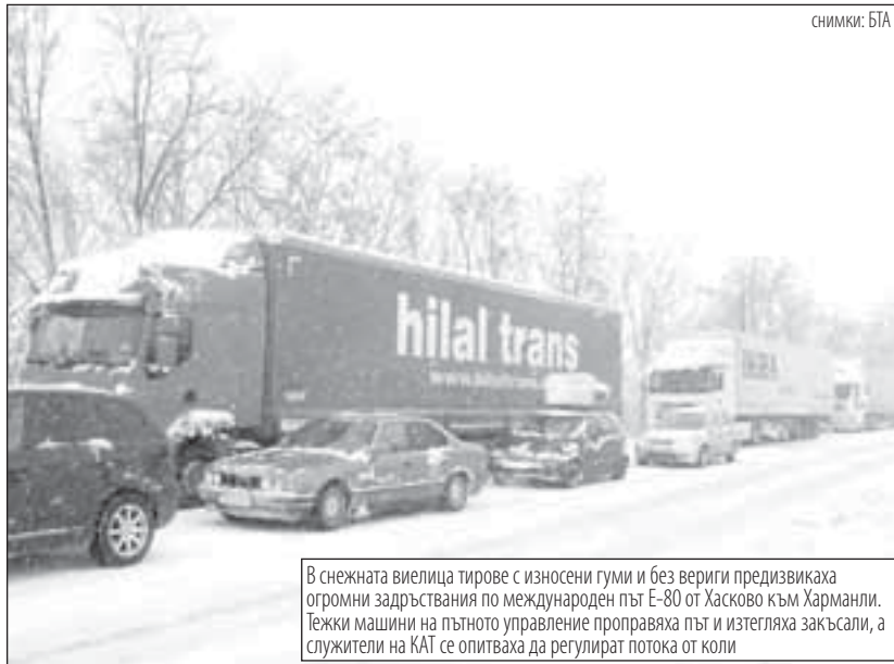
В снежната виелица тирове с износени гуми и без вериги предизвикаха огромни задръствания по международен път Е-80 от Хасково към Харманли. Тежки машини на пътното управление проправяха път и изтегляха закъсали, а служители на КАТ се опитваха да регулират потока от коли

Мъж почина от стуг на автобусна спирка в София. Тялото на човека е открито близо до завод Електроника в столицата. Пристигналата на място линейка е установила, че няма следи от насилие. Телът ще се установява причината за смъртта. Вероятно на