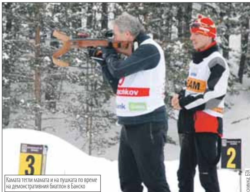
Камата тегли мамата и на пушката по време на демонстративния биатлон в Банско