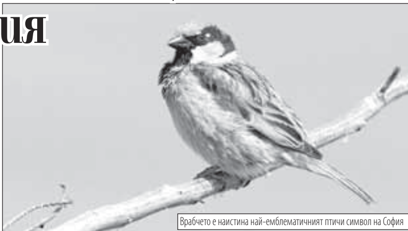
Врабчето е наистина най-емблематичният птичи символ на София

Специално разработеният за целта сайт http://www.bspb.org/birdsymbol представя 12-те най-често срещани и най-познати пернати обитатели на столицата - алпийски бързолет, градска лястовица, гузутка, голям пъстър кълвач, керкenez, кукумявка, кос, голям синигер, славей, горска зигарка, домашно врабче и сойка.