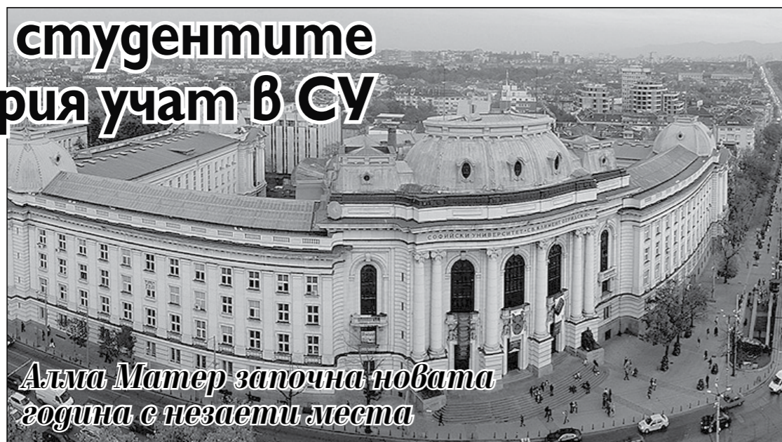
Алма Матер започна новата година с незаети места

По думите му през тази година СУ е победил с 50 места позицията си в класацията QS World University