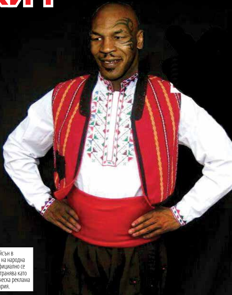
Майк Тайсън в реплика на народна носия официално се разпространява като туристическа реклама на България.