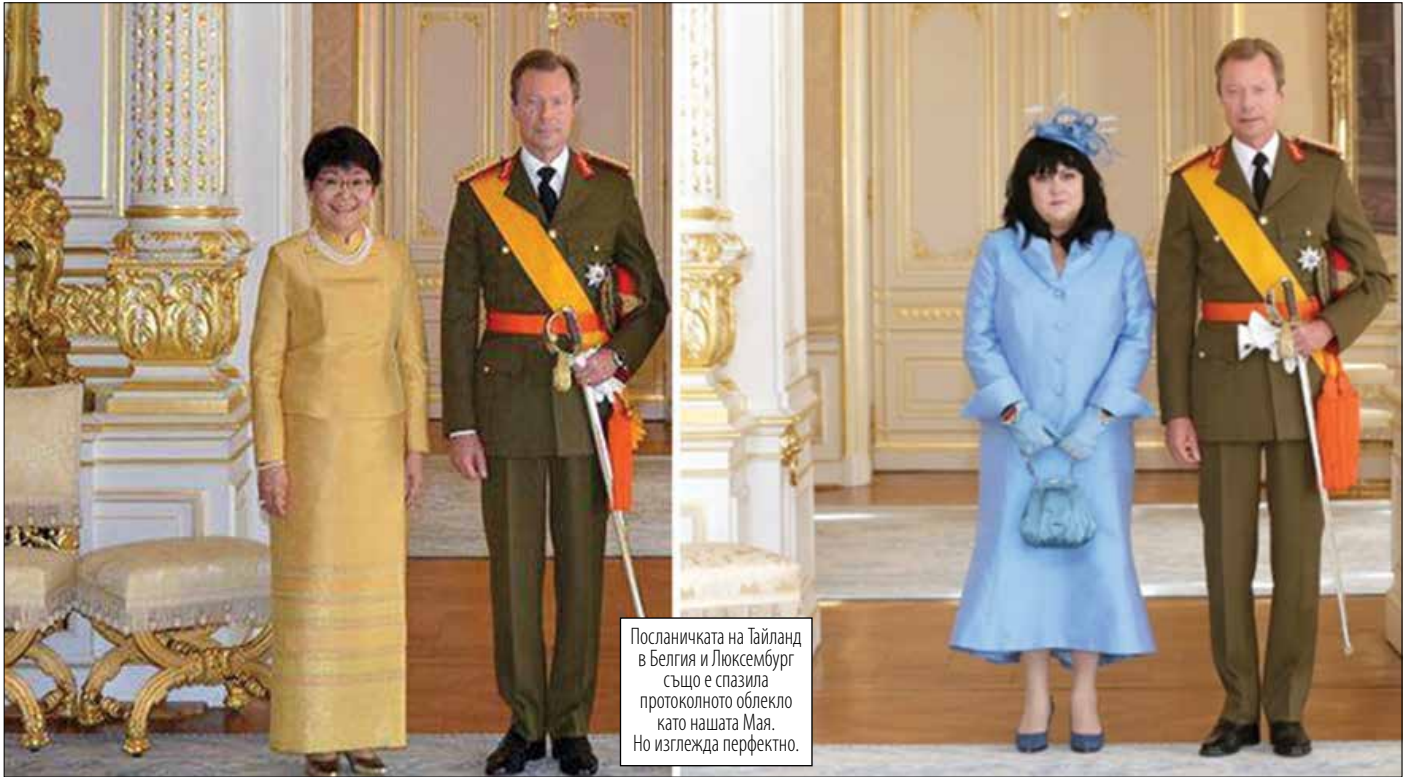
Посланичката на Тайланд в Белгия и Люксембург също е спазила протоколното облекло като нашата Мая. Но изглежда перфектно.