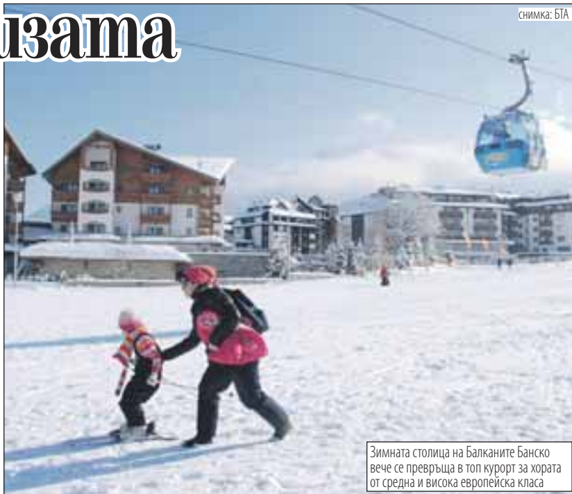
Зимната столица на Балканите Банско вече се превръща в топ курорт за хората от средна и висока европейска класа

Според експертите два са основните шанса за стабилизация по време на криза. Става въпрос за селското стопанство, в частност зърнопроизводството, и туризмът. Заради обедняването на Европа част от туристическия поток