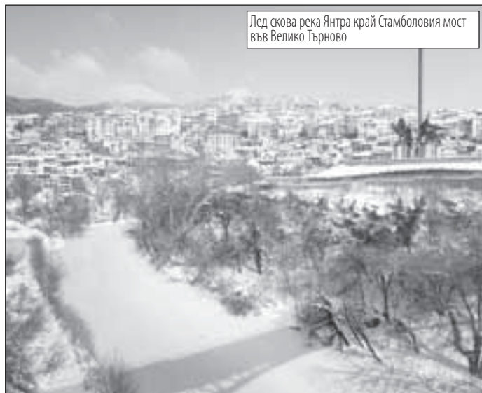
Лед скова река Янтра край Стамболиевия мост във Велико Търново

Температурен рекорд бе регистриран в Русе. В 6 ч. вчера сутринта живакът в термометрите падна до минус 19,9 градуса, което е най-ниската стойност за този ден от 50 години насам. Прогнозите за следващите дни са да стане още по-студено. Десет процентен ледоход е регистриран във водите на река Дунав край Русе - 0,4 градуса е температурата на водата, а крайбрежният лед на места достига до 1,5 метра