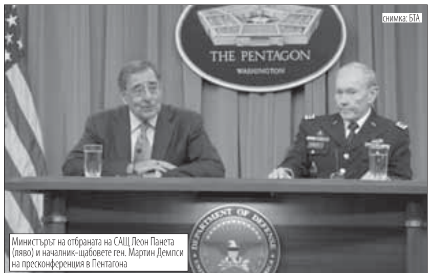
Министърът на отбраната на САЩ Леон Панета (ляво) и началник-щабове ген. Мартин Демпси на пресконференция в Пентагона

Няма да чакаме Иран да направи атомна бомба, отсеке Пентагонът