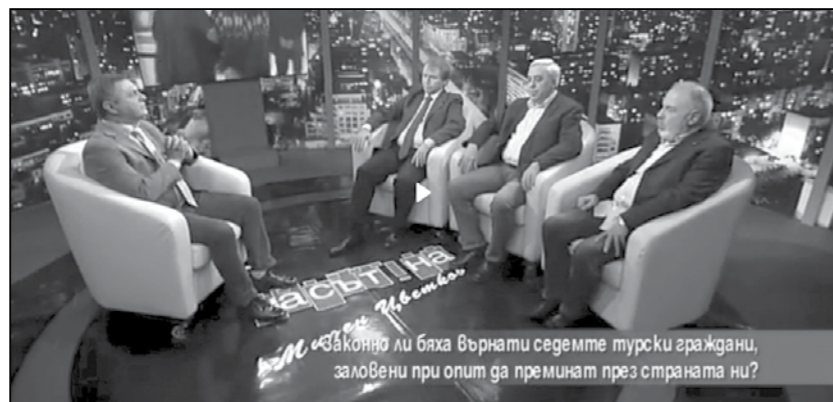
Законно ли бяха върнати седемте турски граждани, заловени при опит да преминат през страната ни?