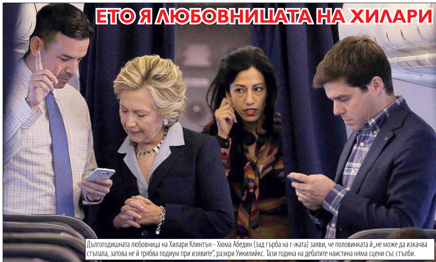
Дългогодишната любовница на Хилари Клинтън – Хюма Абедин (зад гърба на г-жата) заяви, че половинката ѝ „не може да изкачва стъпала, затова не ѝ трябва подиум при изявите“, разкри Уикилийкс. Тази година на дебатите наистина няма сцени със стълби.