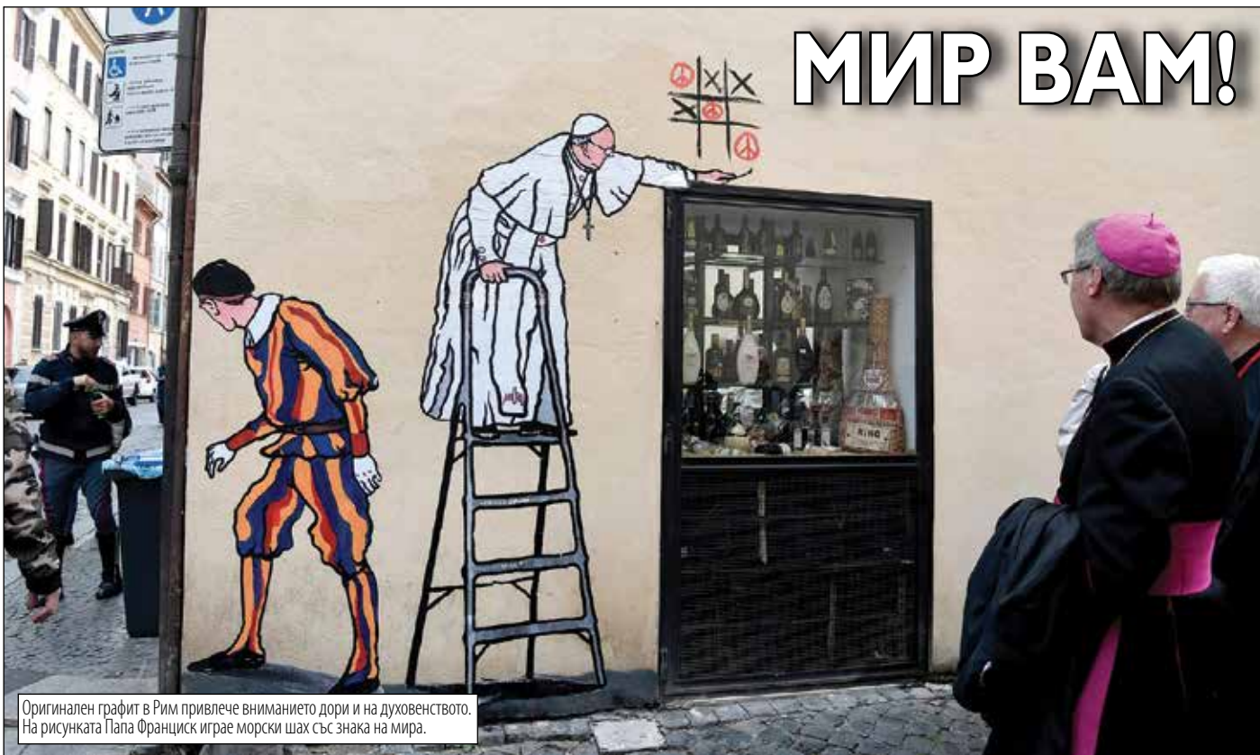
Оригинален графит в Рим привлече вниманието дори и на духовенството. На рисунката Папа Франциск играе морски шах със знака на мира.