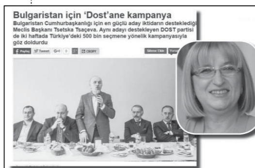
Bulgaristan için 'Dost'ane kampanya

трябва да бъде свързана с бизнеса“, заяви Горанов. „Трябва колегите, които имат претенции, че създават продукт, да не са си самогостатъчни в разбирането колко са важни за обществото, а да положат малко повече усилие“, отбеляза министърът. „Да говорим просто, че трябва да даваме повече издръжка на институти, не всеки от които убегително... извинете, но вие знаете ли например имената на всички институти в БАН – има такива интересни научни направления вътре, които не може да ги свържем с реалността на практика“, заяви още Горанов.