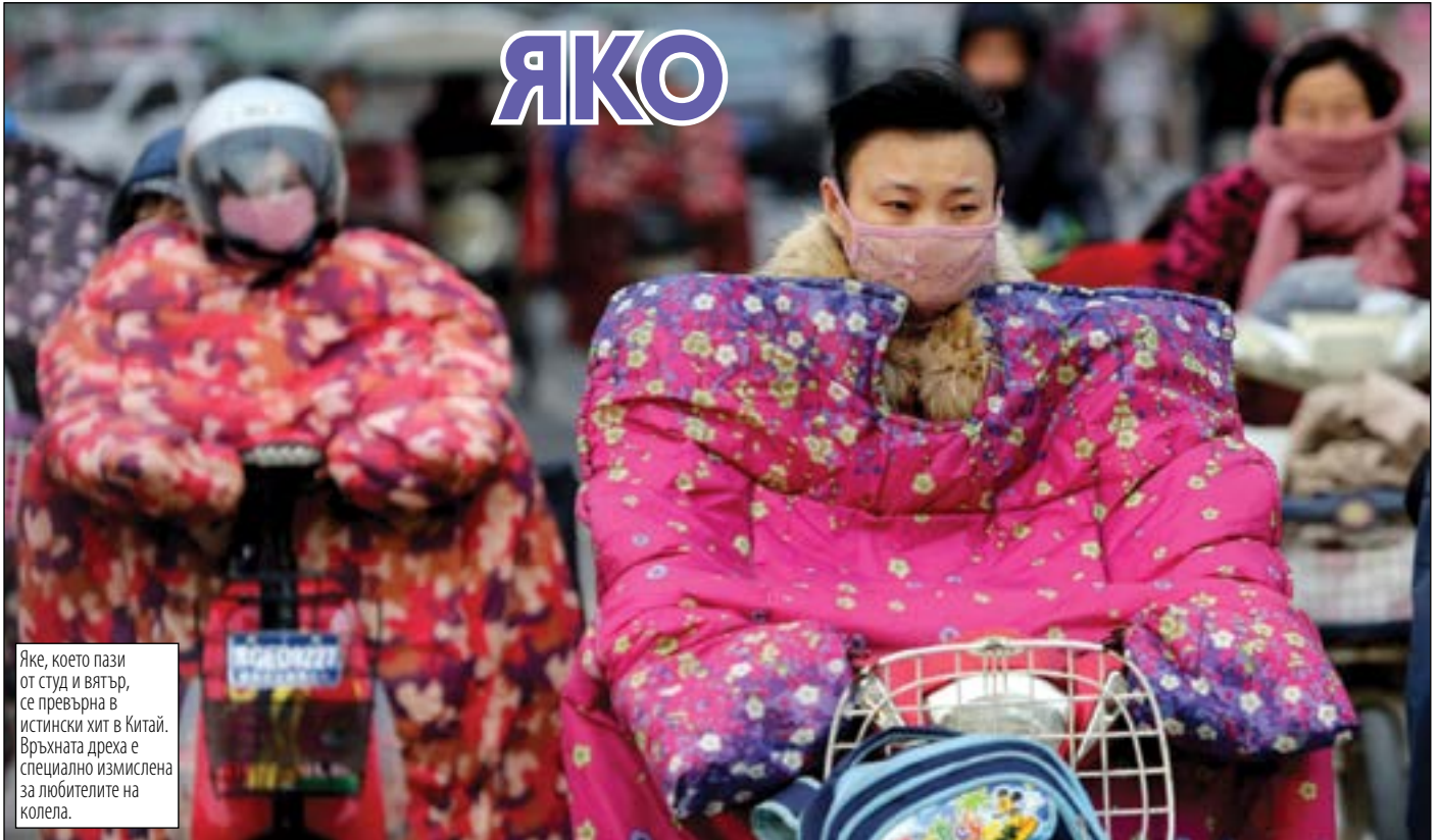
Яке, което пази от студ и вятър, се превърна в истински хит в Китай. Връхната дреха е специално измислена за любителите на колела.