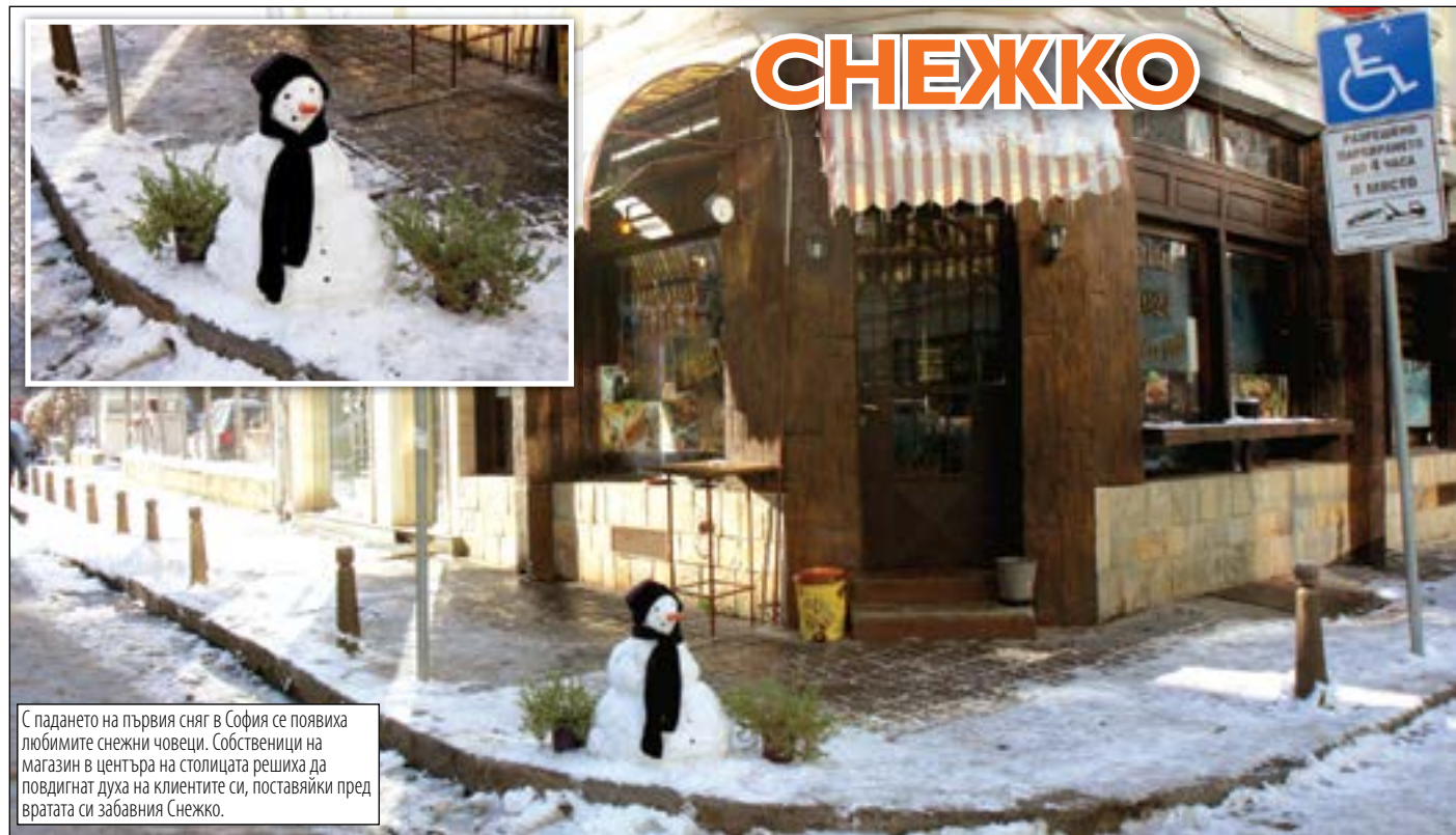
С падането на първия сняг в София се появила любимите снежни човечеци. Собственици на магазин в центъра на столицата решиха да повдигнат духа на клиентите си, поставяйки пред вратата си забавния Снежко.

>>АВТОРИТЕТНАТА МЕДИЯ РАЗКРИ 17% КОМИСИОННИ ПО ЕВРОФОНДОВЕТЕ, ДАВАНИ НА АМЕРИКАНЦИТЕ С ПОДПИСА НА ГЕОРГИЕВА БЪЛГАРИЯ.сmp.2