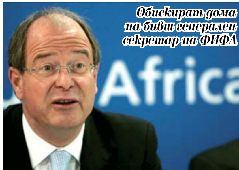
Обискират дома на бивш генерален секретар на ФИФА

В началото на ноември тази година главната прокуратура на Швейцария обяви, че по същия казус започва разследване и срещу