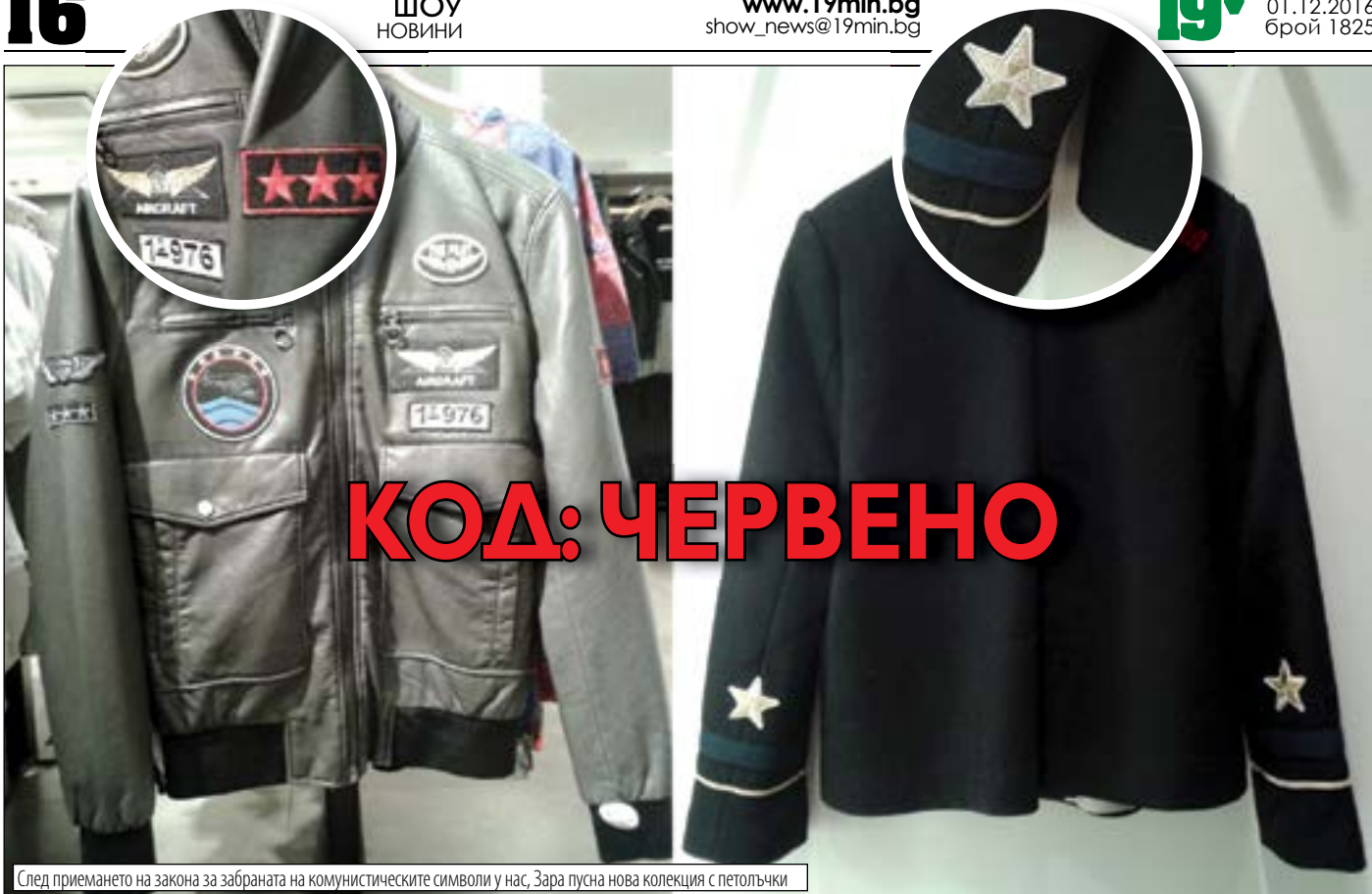
След приемането на закона за забраната на комунистическите символи у нас, Зара пусна нова колекция с пелотълчки