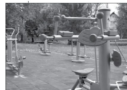
Тази пролет фитнес на открито ще бъде направен и в парк Лебеда в Красна поляна,

София привлича половината от чуждестранните инвестиции в страната, като основната им част са услуги-