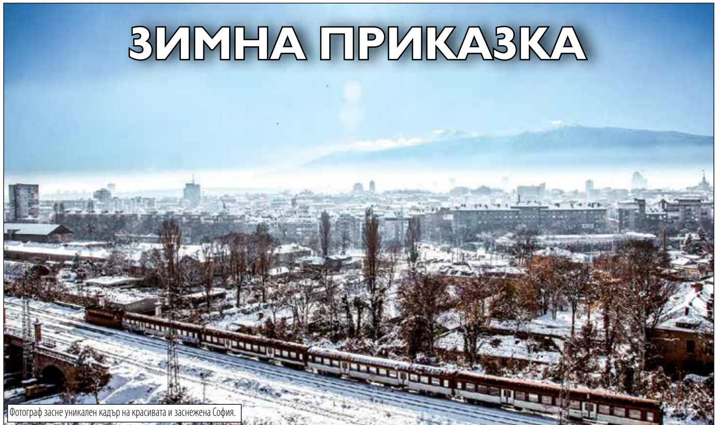
Фотограф засне уникален кадър на красивата и заснежена София.