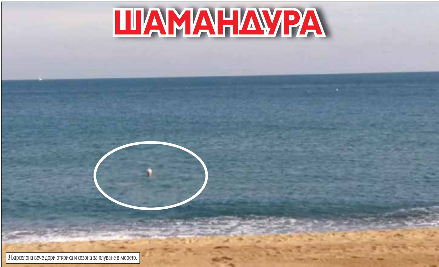
В Барселона вече дори откриха и сезона за плуване в морето.